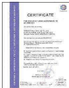
AD 2000 - W 0 İMALAT YETERLİLİK BELGESİ