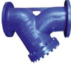
Boşaltım Tapası Piringç Paslanmaz çelik Filtre