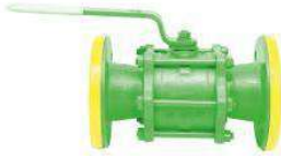
Tabak Yay Takviyeli İçi Dolu Paslanmaz Küreli