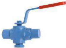
Dövme Çelik 2 ve 3 yollu +250 °C den sonra KAF ring kullanılır.