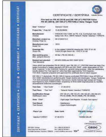
FIRE SAFE PİSTONLU VANALAR-ÇELİK