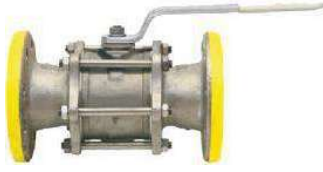
Tabak Yay Takviyeli İç Dolu Paslanmaz Küreli