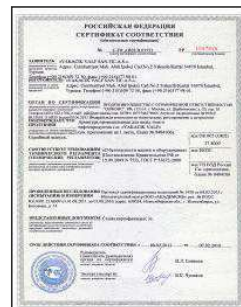
GOST BÜTÜN ÜRÜNLER