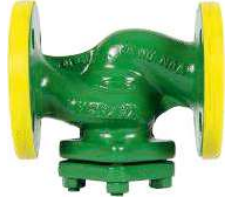
Paslanmaz Çelik Filtre