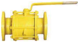
Tabak Yay Takviyeli İç Dolu Paslanmaz Küreli