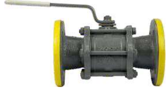
Tabak Yay Takviyeli İçi Dolu Paslanmaz Küreli