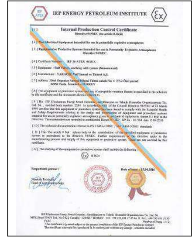
ATEX 94/9/EC the article 8.1b(ii)