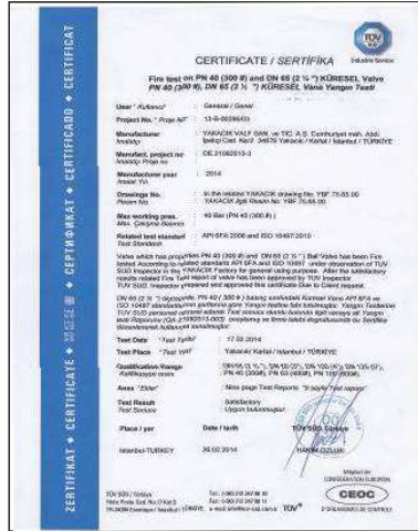
FIRE SAFE KÜRESEL VANALAR-ÇELİK