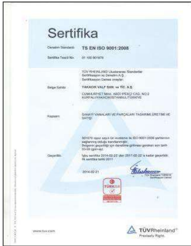
ISO 9001-2008 KALİTE YÖNETİM SİSTEMİ