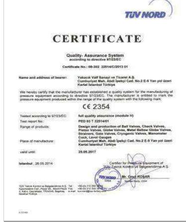
CE 2354 PED 97/23 EC / KATEGORİ III