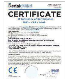
FIRE HYDRANT CE 1922 - CPR - 0566