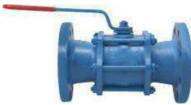
Tabak Yay Takviyeli İçi Dolu Paslanmaz Küreli