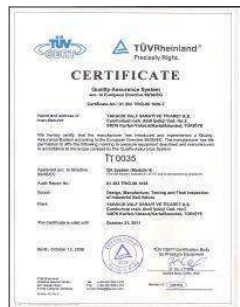
TPED 99 36 TAŞINABİLİR BAS. KAPLAR