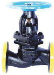
İç Aksamlı Komple Paslanmaz