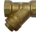
Piringç Gövde Piringç Kapak Paslanmaz Çelik Filtre