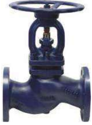
İç Aksamlı Komple Paslanmaz